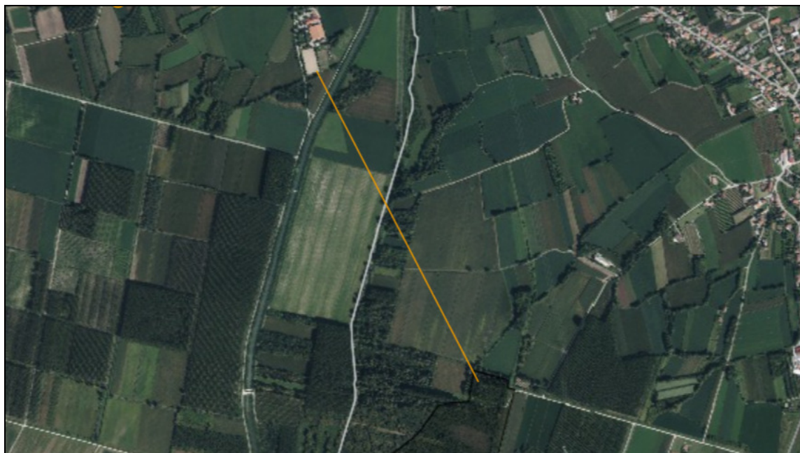
Figura 2. Evidenziata distanza minima (1.050 m.) tra area di variante e ZSC più vicina ovvero Palude Moretto ( Irdat FVG, 2018, mod. ).

si rileva l'assenza di possibili incidenze dirette o indirette sui siti di Natura 2000.